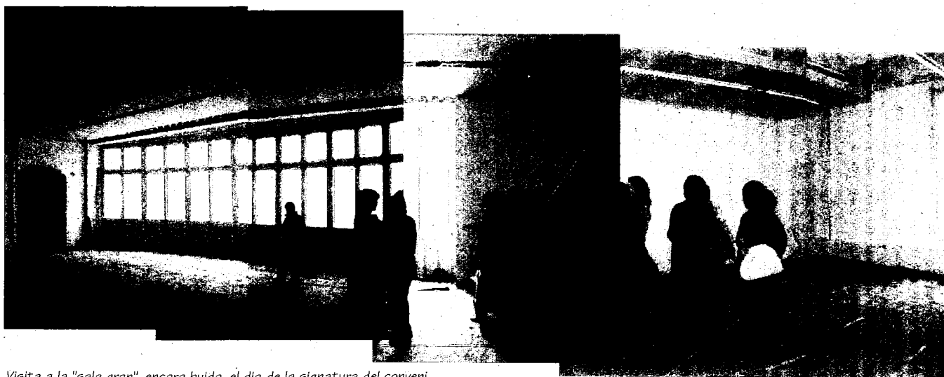
Visita a la "sala gran", encara buida, el dia de la signatura del conveni

Finalment, després de més de quatre anys de lluites, ho hem aconseguit: el dimarts 13 de maig, l'Associació promotora del Centre de Cultura de les Dones "Francesca Bonnemaison" vam signar amb la Diputació de Barcelona el conveni per a la cessió de l'ús de l'espai de l'edifici del carrer Sant Pere més Baix i podem dir: "La Bonnemaison ja és nostra".